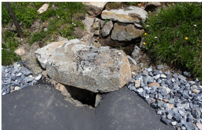
Einlaufschacht - historischer Stil