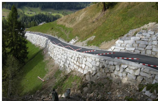
Güterweg Seite Spina