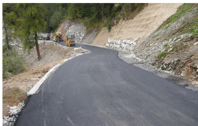
Güterweg Seite Wissigenboden